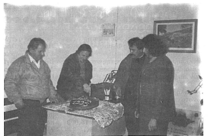
Στιγμιότυπο από την κοπή της πίτας της Κοινότητας Σέρβου.