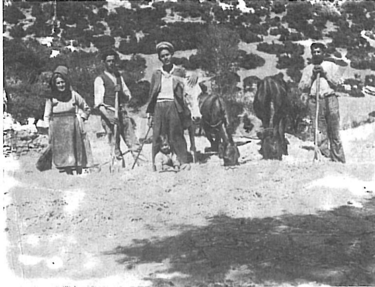
Αλώνισμα στο αλώνι του Θυμακολιά (Τρανηβρούση), το 1942

Σκληρή δουλειά αλλά όμορφη η εικόνα του αλωνίσματος. Από ένα ξύλο χοντρό (το στιχερό), στη μέση του αλωνιού έδεναν με ένα χοντρό σκοινί 3-4 ή και 5 μουλάρια και ο "αλωνιάρης" με μια βίτσα στο χέρι τα γύριζε