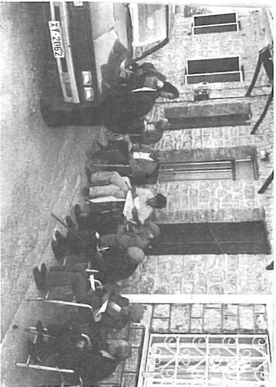
Μια γραφική εικόνα από τους απομαχούς της ζωής ανταξίουχους του ΙΚΑ, που έχουν παιταώσει τον ταχυόρμιο για να πάρουν τη συνταγή τους.

και Χρώμα της γιορτής καθώς πετάει η καρδιά τους οι εύθυμοι από ιδιοσυγκρασία Αρδμπεδς, στήσαν και πάλι εφέτος στην αυλή της εκκλησίας το χορό. Εκεί που άλλοτε το λάδαγαν οι διάσημοι τραγουδιστές και χορευταρδέδες Δικαίοι με πρώτο τον Κωνσταντή να σερβει το χορό και σαν τον πέφτει η σκούφια να μην την παίρνει αν δεν τελώσει ο χορός.